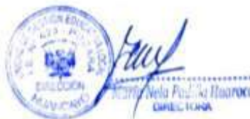
IMAGEN N° 3: Envío de oficio por CAE informando la cantidad de usuarios