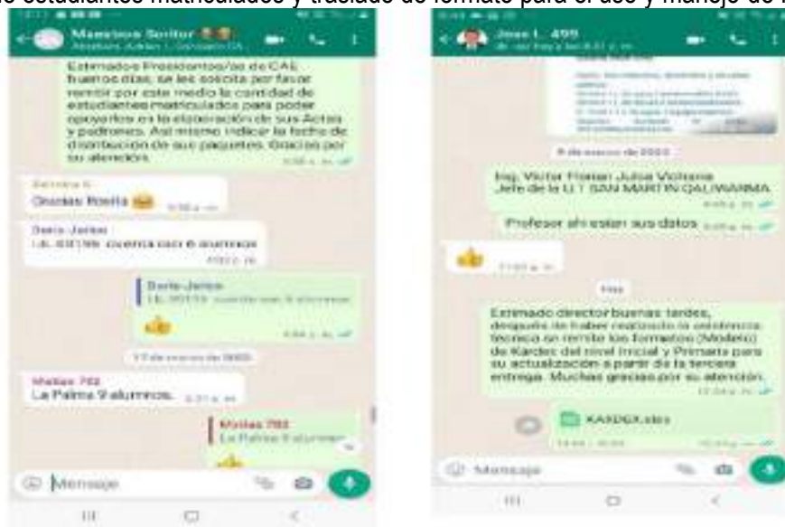
Imagen N° 03: Evidencias de asistencia técnica respecto a la actualización de usuarios