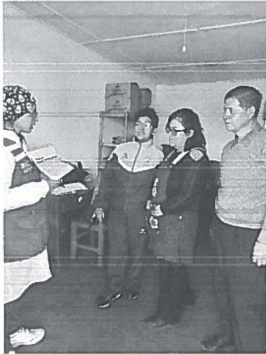
foto: Capacitación al miembro CAE sobre sus funciones

Conclusión: Con fecha 11 de mayo el CAE recibió asistencia técnica / capacitación en relación a sus funciones, suscribiendo acuerdo para aplicación y cumplimiento. El caso se concluye FUNDADO.