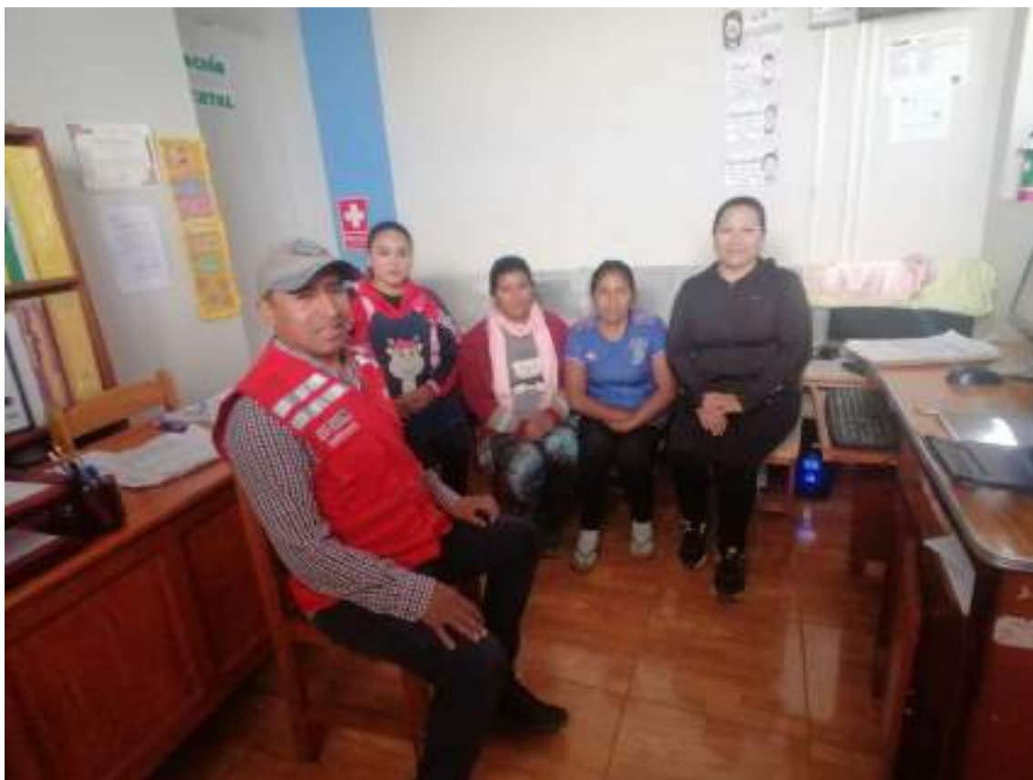
Anexo 06: Registro fotográfico de la capacitación centralizada al CAE de la IE 419 con fecha 22/05/2023.