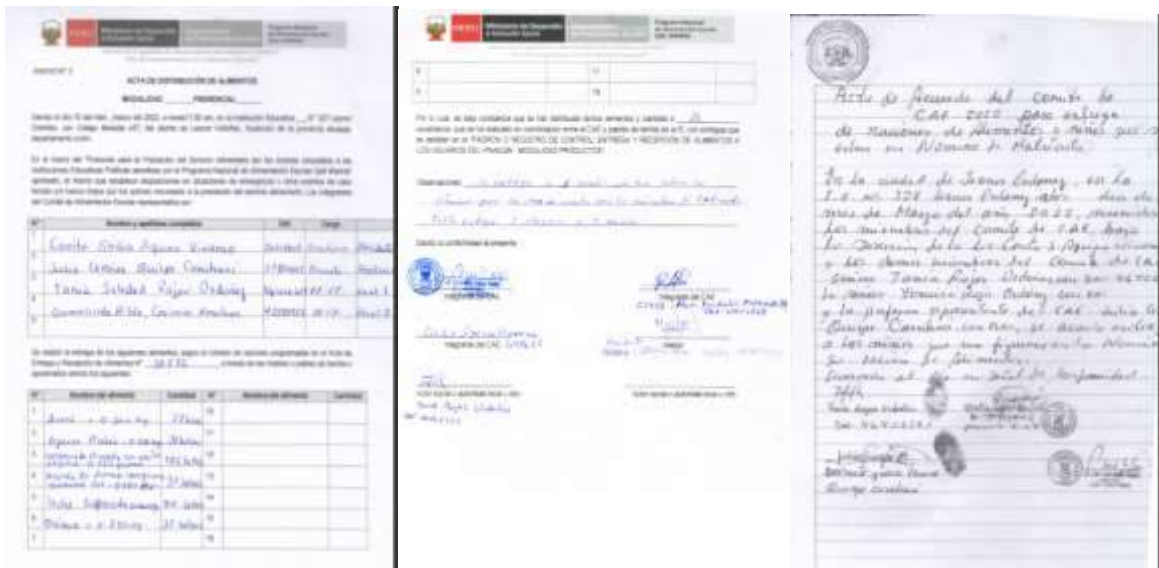
Imagen 01: Acta y Padrón de distribución, 1ra entrega

Con fecha 10/03/2022, se realizó la distribución de los alimentos de la primera entrega, Imagen 03, indicando la entrega de 03 raciones a usuarios que asisten a clases pero que aún no figuraban en nómina, según acuerdo que consta en Libro de Actas, entre el personal CAE. Se entregaron a 35 usuarios, quedando 02 raciones en almacén, las cuales se repartieron en la segunda distribución.