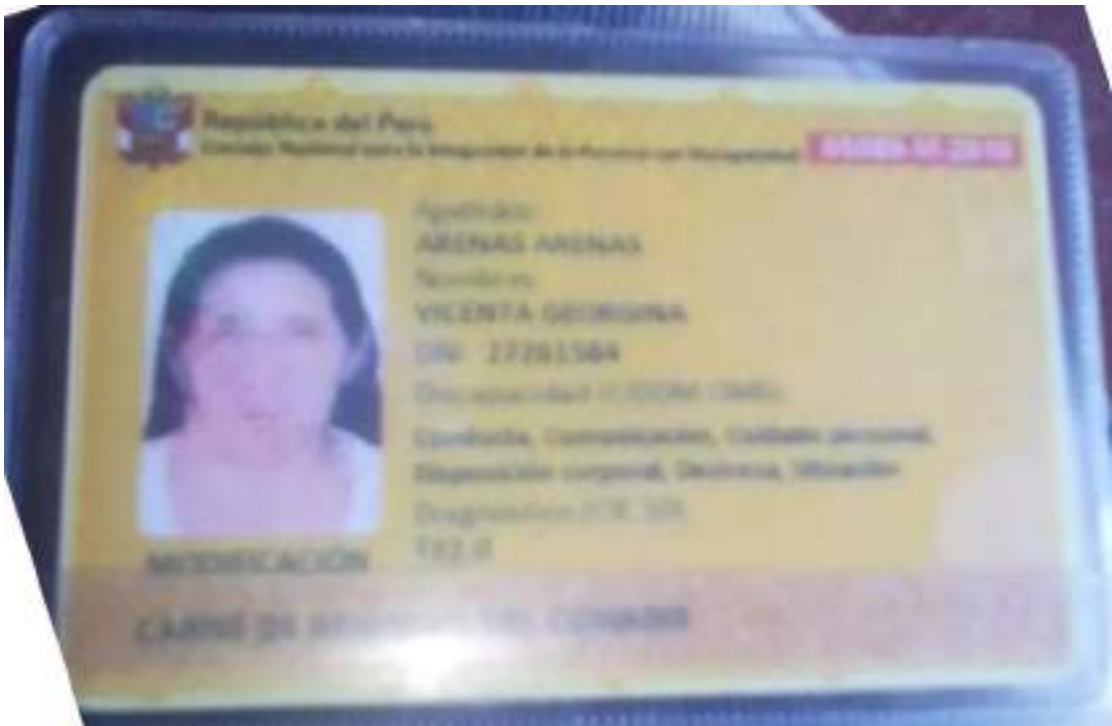
Anexo 04: Fotografía de Carnet de discapacidad.