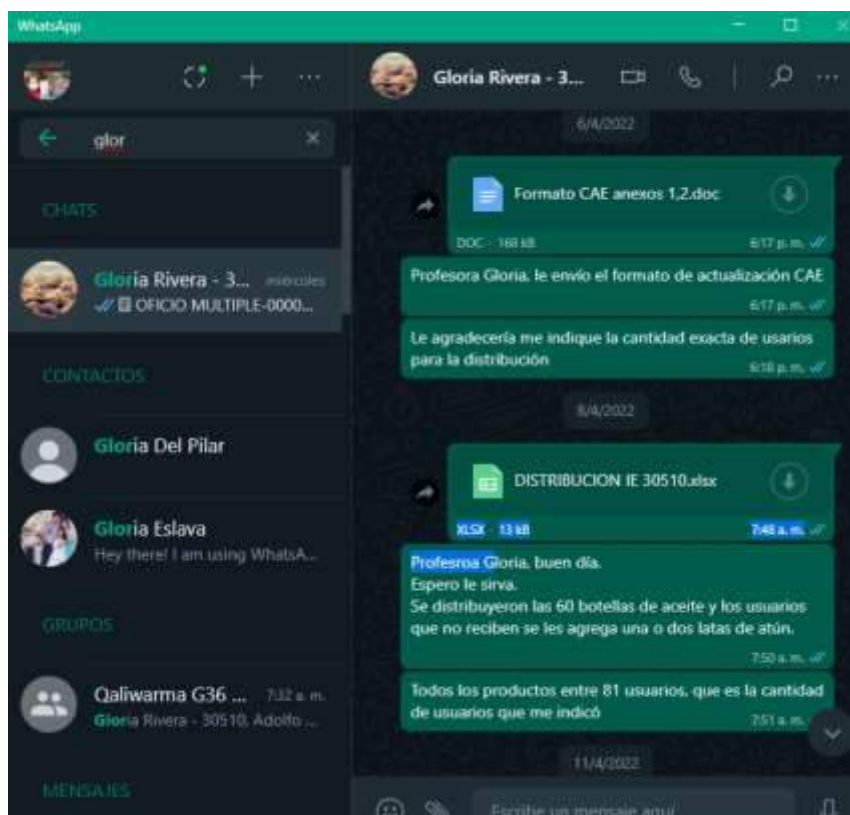
Imagen 01: Envío de la distribución de productos a 81 usuarios

Con fecha 08/4/2022 se envía la distribución de productos de la primera y segunda entrega, mediante archivo Excel entregar a los 81 usuarios, previa coordinación con la directora Gloria Rivera.