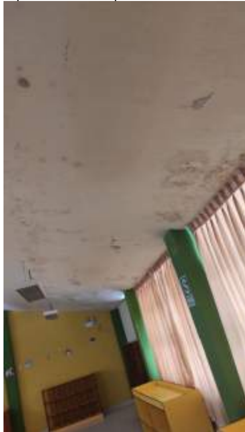
Imagen 05 espacio donde consumen los alimentos los usuarios (no hay desprendimiento de pintura).

Imagen 04 a pesar de la limpieza realizado quedan huellas del desprendimiento de la pintura