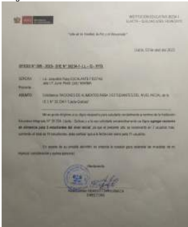
Imagen 03 oficio remitiendo la cantidad de estudiantes matriculados (14)

A continuación, se procedió a brindar asistencia técnica al CAE respecto al Procedimiento para la Actualización del Lista de Instituciones Educativas Públicas en la cobertura del PNAEQW aprobado con Resolución de Dirección Ejecutiva N° D000259-2022-MIDIS/PNAEQW-DE de fecha 23/06/2022, precisando lo siguiente: