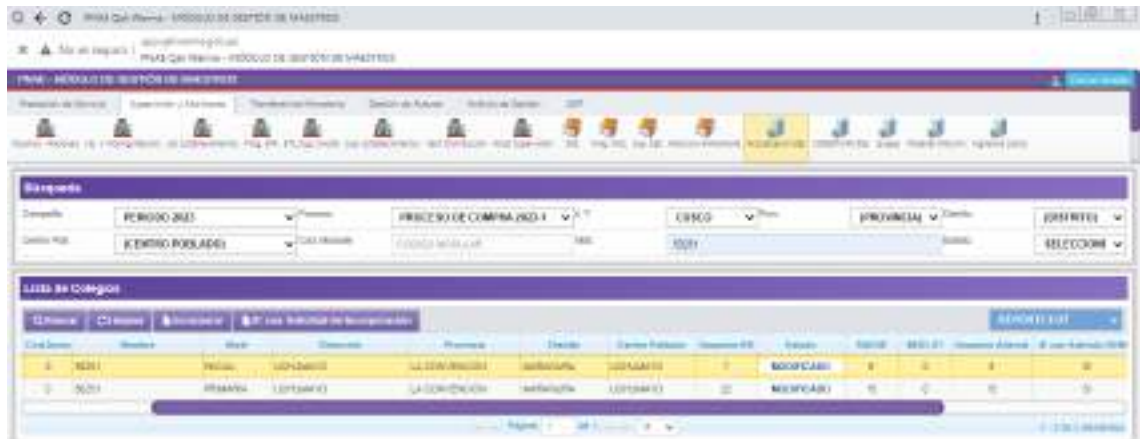
figura1. Pantallazo de la cantidad de estudiantes Sistema Integrado de Gestión Operativa (SIGO)

Cabe mencionar que para el proceso de actualización de usuarios el programa cuenta con la normativa del protocolo según lo mencionado líneas arriba por lo cual el proceso de actualización se realiza de acuerdo a los datos registrados de cantidad de usuarios en el SIAGIE del MINEDU. Siguiendo el procedimiento de acuerdo a RDE N° D000259-2022-MIDIS/PNAEQW-DE en la cual la IIEE actualmente ya se encuentra registrada en el Sistema Integrado de Gestión Operativa (SIGO) para la actualización de usuarios el cual se encuentra en proceso. Según se evidencia en la foto de pantallazo. Teniendo en cuenta que es responsabilidad de la directora mantener actualizado el SIAGIE con la data exacta de cantidad de estudiantes.