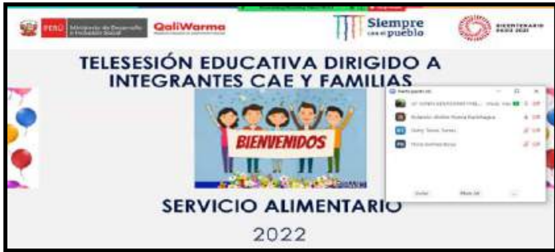
Imagen 1. Telesesión educativa tema incluido sobre el arroz fortificado dirigido a integrantes de CAE y familia 2022.

Como acción correctiva se realiza la un replica exclusiva para la institución educativa 30747 para fortalecer sus capacidades en temas transversales del Programa Nacional de Alimentación Escolar, donde se ejecutaron y se enseñó a registrarse en los enlaces de asistencia para los registros pertinentes.