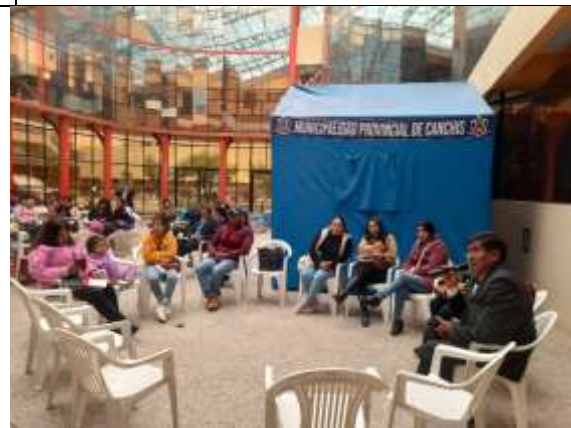
CAPACITACION CENTRALIZADA A INTEGRANTES CAE DE LAS INSTITUCIONES EDUCATIVAS DEL NIVEL INICIAL DEL DISTRITO DE SICUANI, FECHA: 17/04/2023