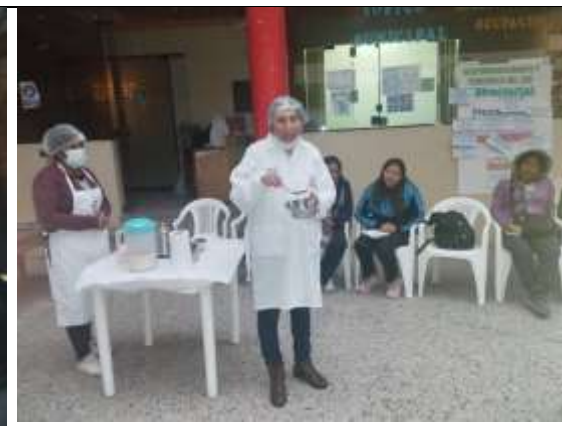
SESION DEMOSTRATIVA: SERVIDO DE RACIONES NIVEL INICIAL URBANO Y RURAL, FECHA: 17/04/2023