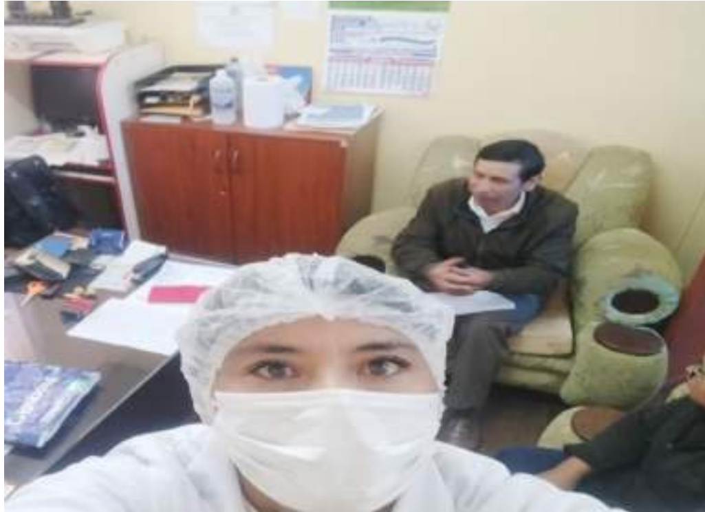
IMAGEN DE LA ASISTENCIA TECNICA ACTORES SOCIALES

"Decenio de la Igualdad de Oportunidades para Mujeres y Hombres" "Año de la unidad, la paz y el desarrollo"