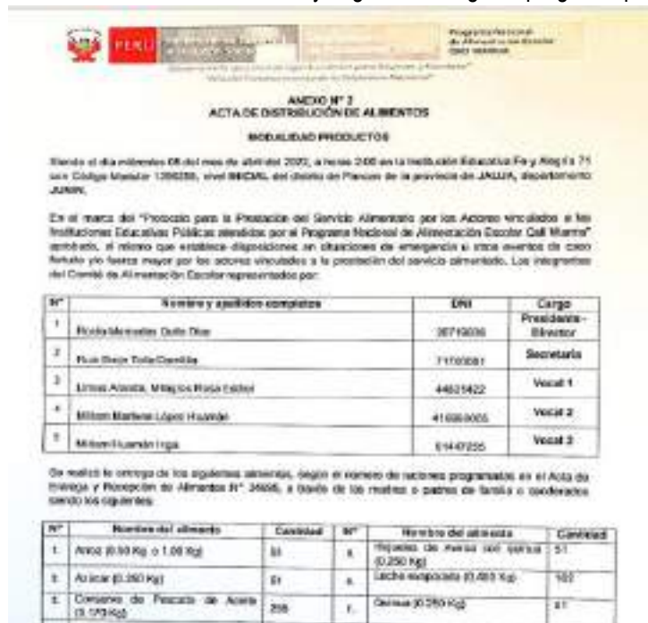
Imagen 3. Acta de Distribución de los Alimentos.