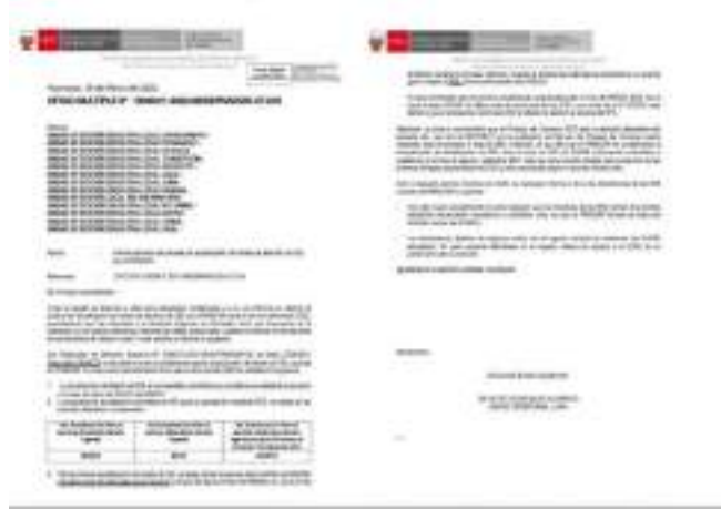
Imagen 5. Oficio múltiple

"Decenio de la Igualdad de Oportunidades para Mujeres y Hombres" "Año del Fortalecimiento de la Soberanía Nacional"