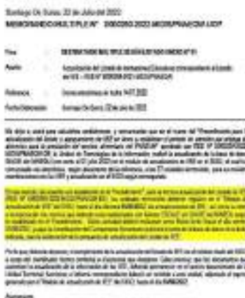
Imagen 1. Memorando Múltiple

-El 22/07/2022 se emite el Memorando Múltiple N°000260-2022-MIDIS/PNAEQW-UOP Actualización del listado de Instituciones Educativas correspondientes al listado de IIEE RDE N°D000268-2021-MIDIS/PNAEQW-DE, (con corte al 01 de julio 2022).