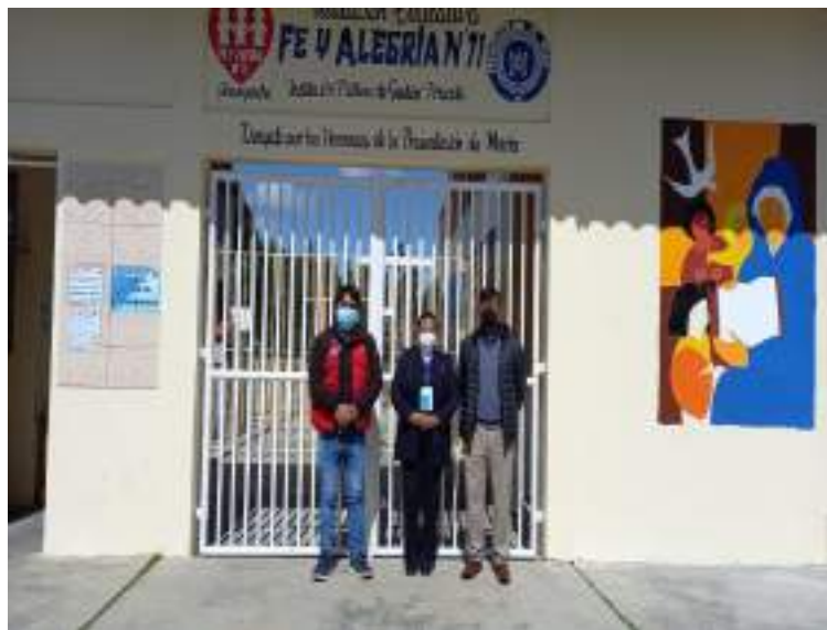
Imagen 3. Asistencia técnica al CAE

-Con fecha 04/08/2022 se brindó asistencia técnica, sobre el procedimiento de Actualización de Usuarios y se logra el compromiso del CAE respecto a la alerta presentada.