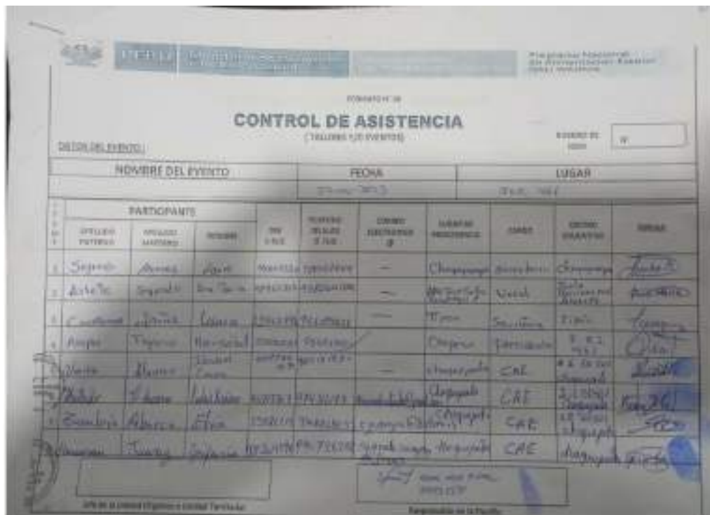
Fig.2 (Control de asistencia a la capacitación centralizada y practica demostrativa)

Verificable la capacitación recibida por los mencionados el Control de asistencia a la capacitación centralizada y practica demostrativa.