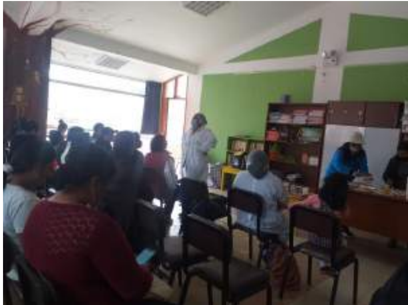
Fig 3 (Fotografía de capacitación centralizada y practica demostrativa a miembros CAE)

2. PERSONA QUE PREPARA ALIMENTOS NO USA INDUMENTARIA LIMPIA, COMPLETA. Durante la vigilancia al servicio alimentario se observó que la persona que realiza la preparación de alimentos no usa indumentaria completa, solo mandil. Esta situación contravendría lo indicado en la RDE N° D000187-2023-MIDIS/PNAEQW-DE "Norma Técnica para la prestación del servicio alimentario por los actores vinculados a las instituciones educativas públicas atendidas por el Programa Nacional de Alimentación Escolar Qali Warma" 5.1.2.3. Preparación de alimentos viii. Usar indumentaria limpia, en buen estado y completa; mandil, mascarilla y cubre cabello.