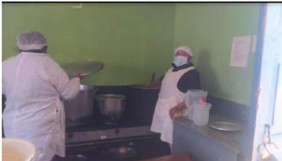
Fig. 5 fotografías cocineras con indumentaria completa y limpia

Finalmente, el CAE asume su compromiso de que todas las personas que preparan sirven y distribuyen alimentos usan indumentaria completa y limpia.