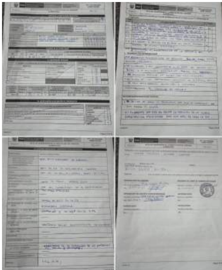
Fig.3 Evidencia acta de supervisión del 09/05/2023

2. LUGAR DE PREPARACION DE ALIMENTOS NO ESTA PROTEGIDO CONTRA EL INGRESO DE ANIMALES. El área de preparación de alimentos no cuenta con mallas que eviten el ingreso de insectos o animales, lo cual afectaría la inocuidad de la preparación de alimentos. Esta situación podría contravenir con lo establecido en la RDE N° D000187-2023- MIDIS/PNAEQW-DE "Norma Técnica para la prestación del servicio alimentario por los actores vinculados a las instituciones educativas públicas atendidas por el Programa Nacional de Alimentación Escolar Qali Warma" 5.1.2.3. Preparación de alimentos i. Disponer de un ambiente exclusivo o acondicionado para la preparación de los alimentos, el cual debe garantizar las condiciones de calidad e inocuidad de los mismos.