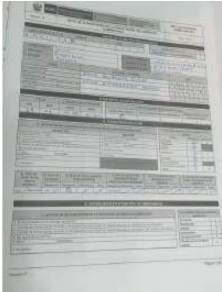
Fig.1 (Acta de supervisión al servicio alimentario del 25/04/2023).

de sobrestock, horarios de consumo del desayuno QW, proceso de actualización de usuarios. Verificable en el acta de supervisión suscrita.