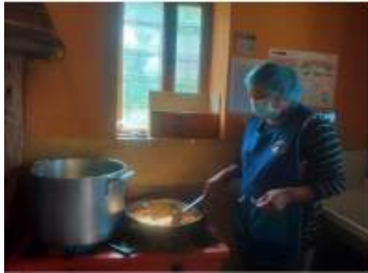
Fig.4 Personal de cocina con indumentaria completa y limpia

3.- PERSONA QUE SIRVE ALIMENTOS NO USA INDUMENTARIA LIMPIA, COMPLETA. Durante la vigilancia al servicio alimentario se observó que la persona que realiza el servido de alimentos no usa indumentaria completa, solo mandil. Esta situación contravendría lo indicado en la RDE N° D000187-2023-MIDIS/PNAEQW-DE "Norma Técnica para la prestación del servicio alimentario por los actores vinculados a las instituciones educativas públicas atendidas por el Programa Nacional de Alimentación Escolar Qali Warma" 5.1.2.4. Servido de alimentos Usar, de manera previa al servido de alimentos, indumentaria limpia, en buen estado y completa; mandil, mascarilla y cubre cabello.