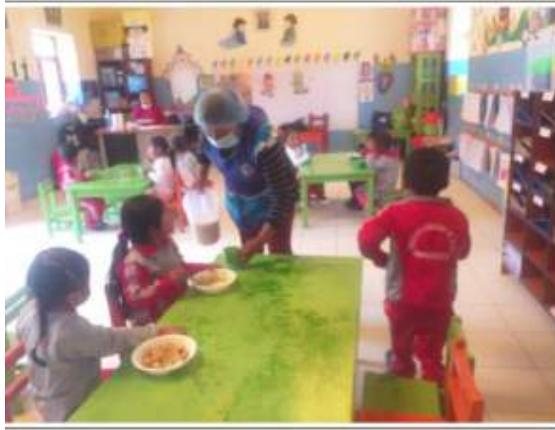
Fig.5 Personal distribuye alimentos con indumentaria completa y limpia

Es necesario señalar que la persona que distribuye los alimentos es la misma que los prepara y sirve por ser el personal permanente. Tal como se aprecia en el acta de supervisión de fecha 25/04/23. En Anexos.