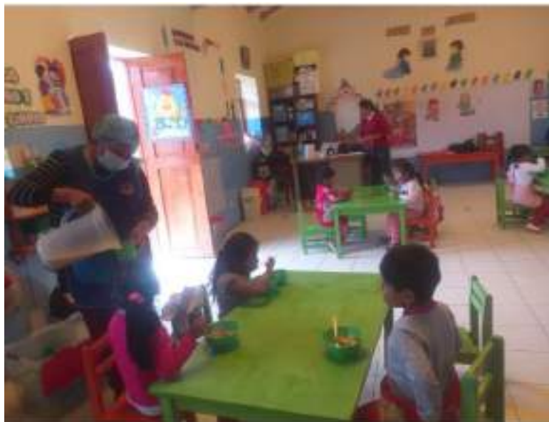
Fig.4 persona que sirve usa indumentaria completa y limpia

4. PERSONA QUE DISTRIBUYE ALIMENTOS NO USA INDUMENTARIA LIMPIA, COMPLETA. Durante la vigilancia al servicio alimentario se observó que la persona que realiza la distribución de alimentos no usa indumentaria completa, solo mandil. Esta situación contravendría lo indicado en la RDE N° D000187-2023-MIDIS/PNAEQW-DE "Norma Técnica para la prestación del servicio alimentario por los actores vinculados a las instituciones educativas públicas atendidas por el Programa Nacional de Alimentación Escolar Qali Warma" 5.1.2.5. Distribución de alimentos i. Usar, previo a la distribución de alimentos, indumentaria limpia, en buen estado y completa; mandil, mascarilla y cubre cabello.