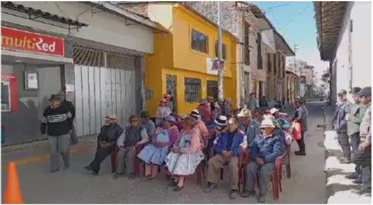
No se habilito carpas para protección del sol