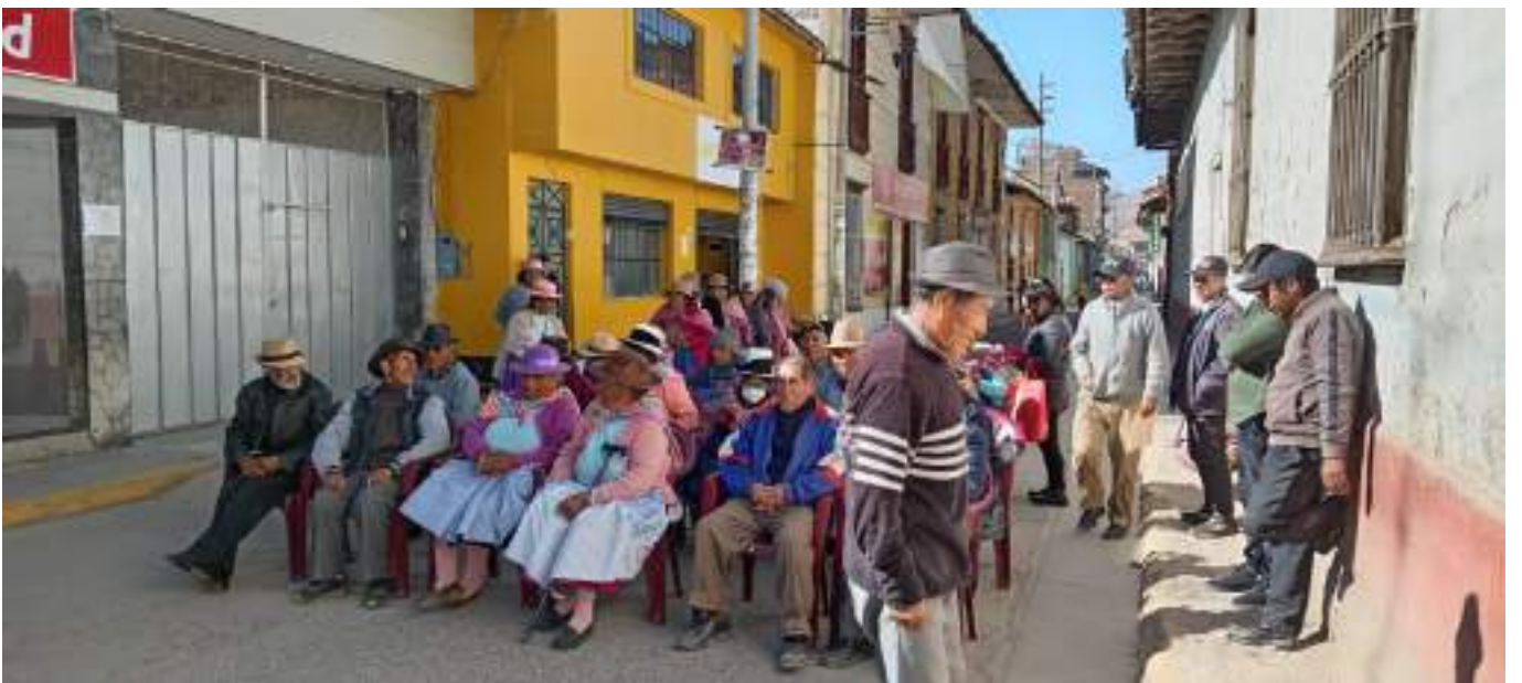
No se habilito carpas para protección del sol