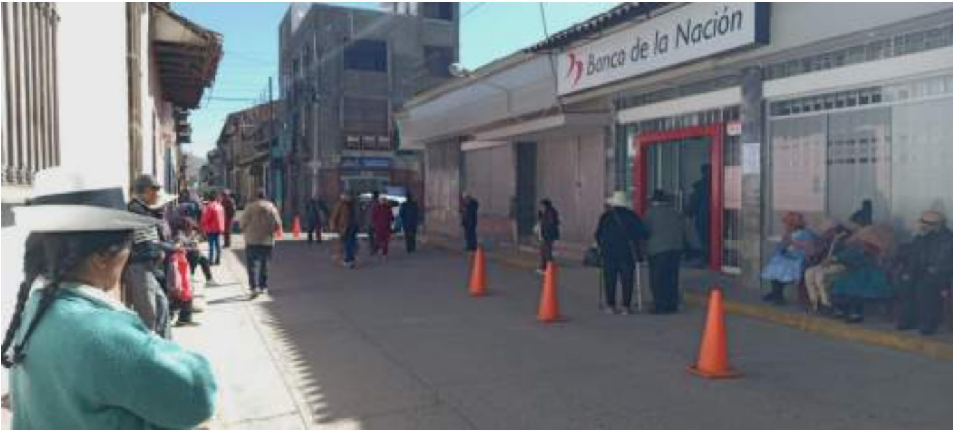
Ausencia de la PNP o Serenazgo durante el operativo de pago

3.- Tres(3) fotografías de las afueras de la agencia del banco de la nación de la provincia de Jauja.