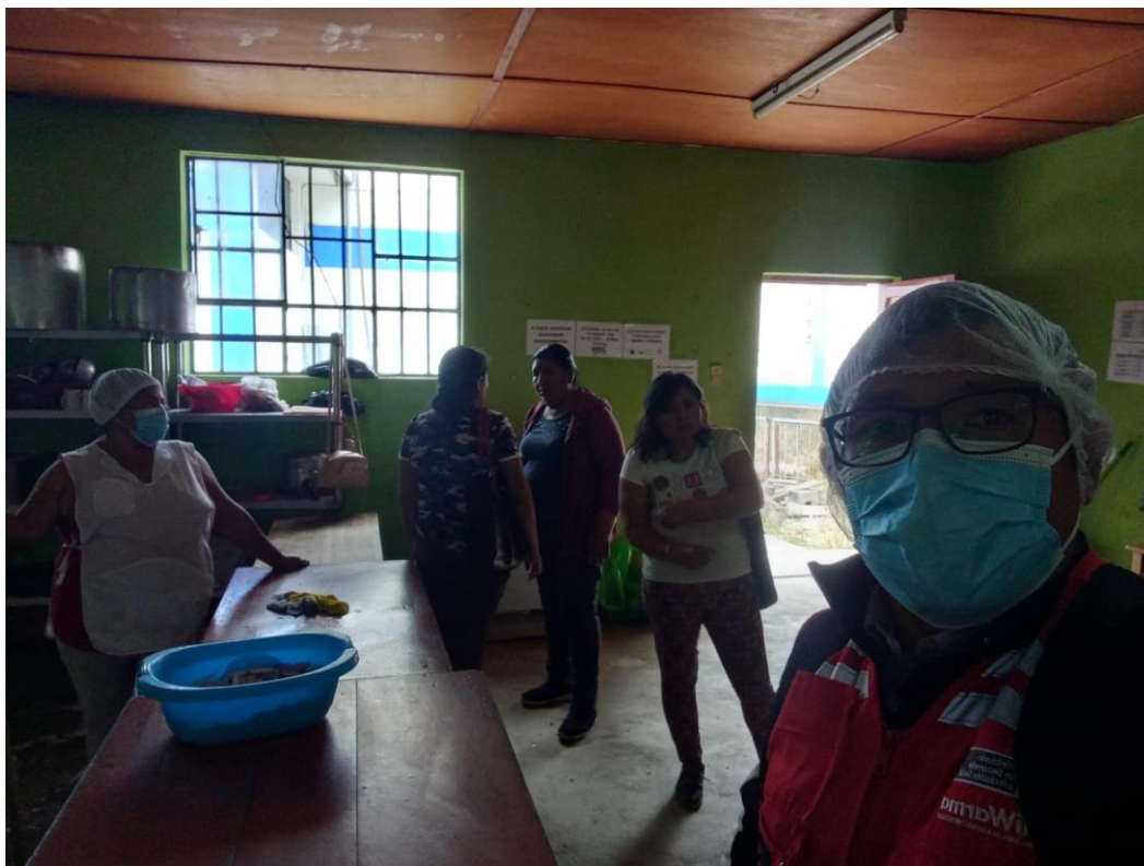
Anexo N° 06: Foto de capacitación presencial a los padres de familia y cae en la institución educativa Ricardo Flores Guitierrez

"Decenio de la Igualdad de Oportunidades para Mujeres y Hombres" "Año de la unidad, la paz y el desarrollo"