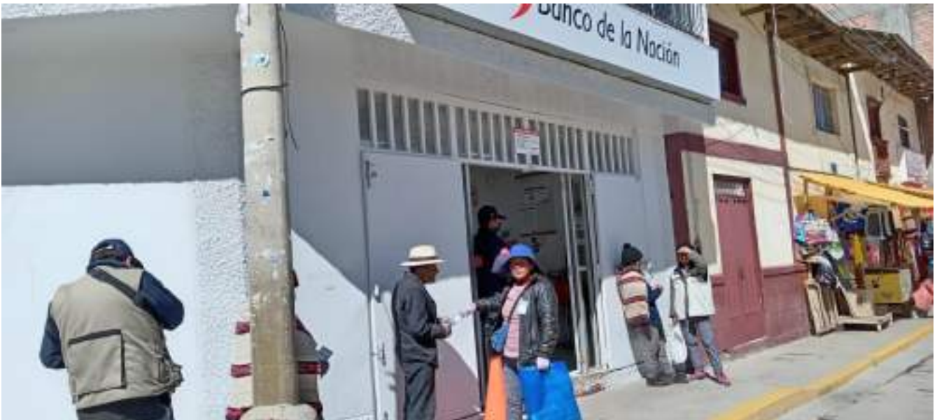
Afuera del banco de la nación no se encontraron sillas y carpas