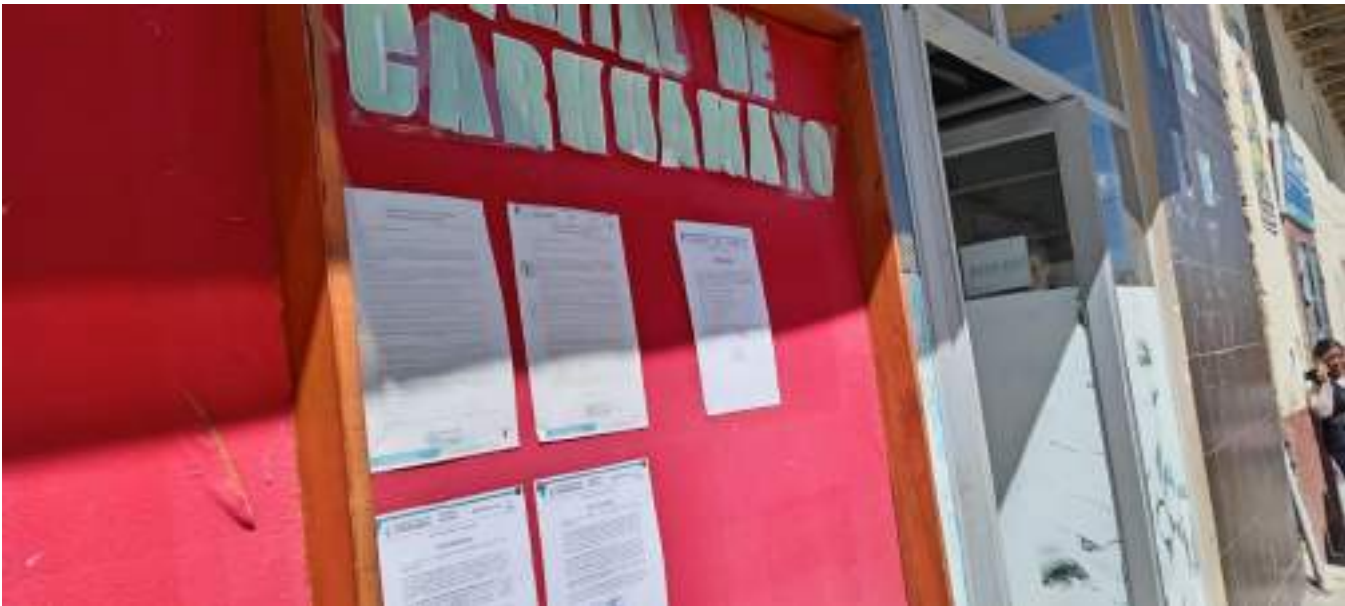
Panel informativo de la municipalidad distrital de Carhuamayo

2.- Una (1) fotografías del panel informativo de la municipalidad distrital de Carhuamayo.