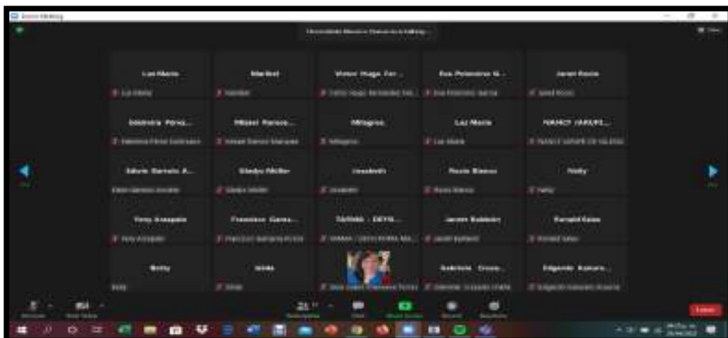
Imagen 1. telesesión educativa dirigido a integrantes de CAE y familia 2022

El CAE recibió asistencia técnica en la fecha 24/03/2022 siendo esta en la modalidad remota a través del zoom, la asistencia técnica tenía como nombre "telesesión educativa dirigido a integrantes de CAE y familia 2022" no fue un solo tema como sustenta la CTVC solo de funciones de CAE, pero en la capacitación virtual se tocaron temas del servicio alimentario del Programa Nacional de Alimentación Escolar, en la siguiente imagen 1 se puede visualizar la telesesión educativa dirigido al CAE y familias. Con fecha 23/03/2022.