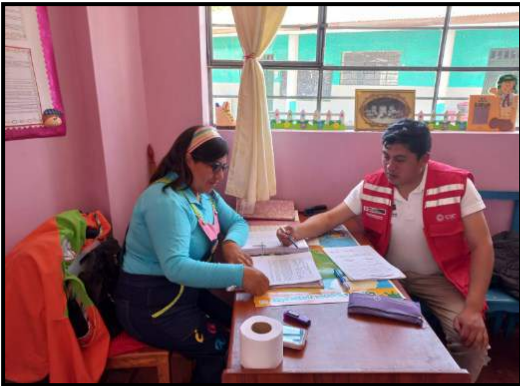
Imagen 1. Asistencia técnica la CAE para sobre las normativas vigentes según Dirección de Educación Regional Junín.