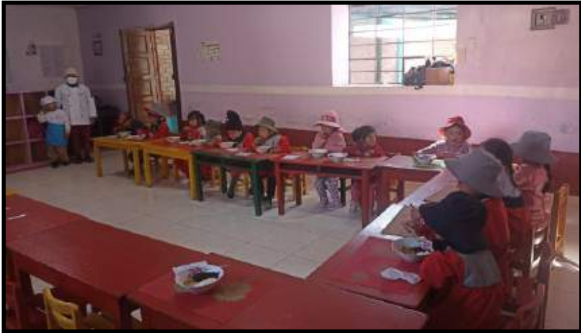
Imagen 4. Seguimiento de compromisos en el horario de consumo.