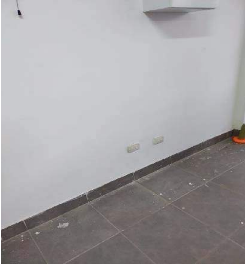
Anexo 5 – sala de caminantes y exploradores cuentan con tomacorrientes protegidos