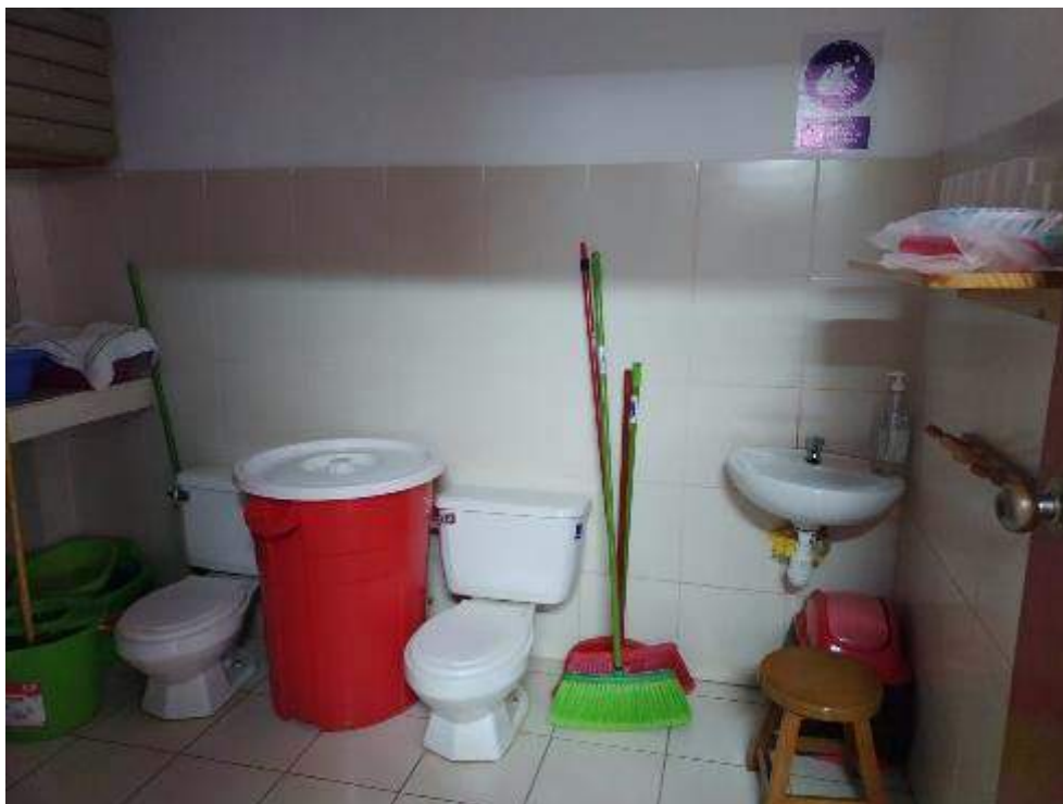
Anexo 6 – Espacio de los servicios higiénicos de los usuarios se encuentra desordenado con materiales de limpieza