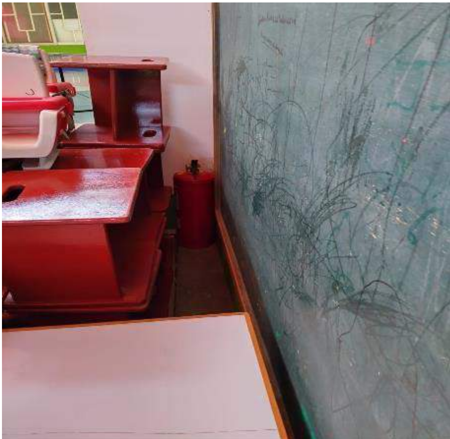
Anexo 4 – Extintor se encuentra ubicado en el piso y al alcance de los niños.