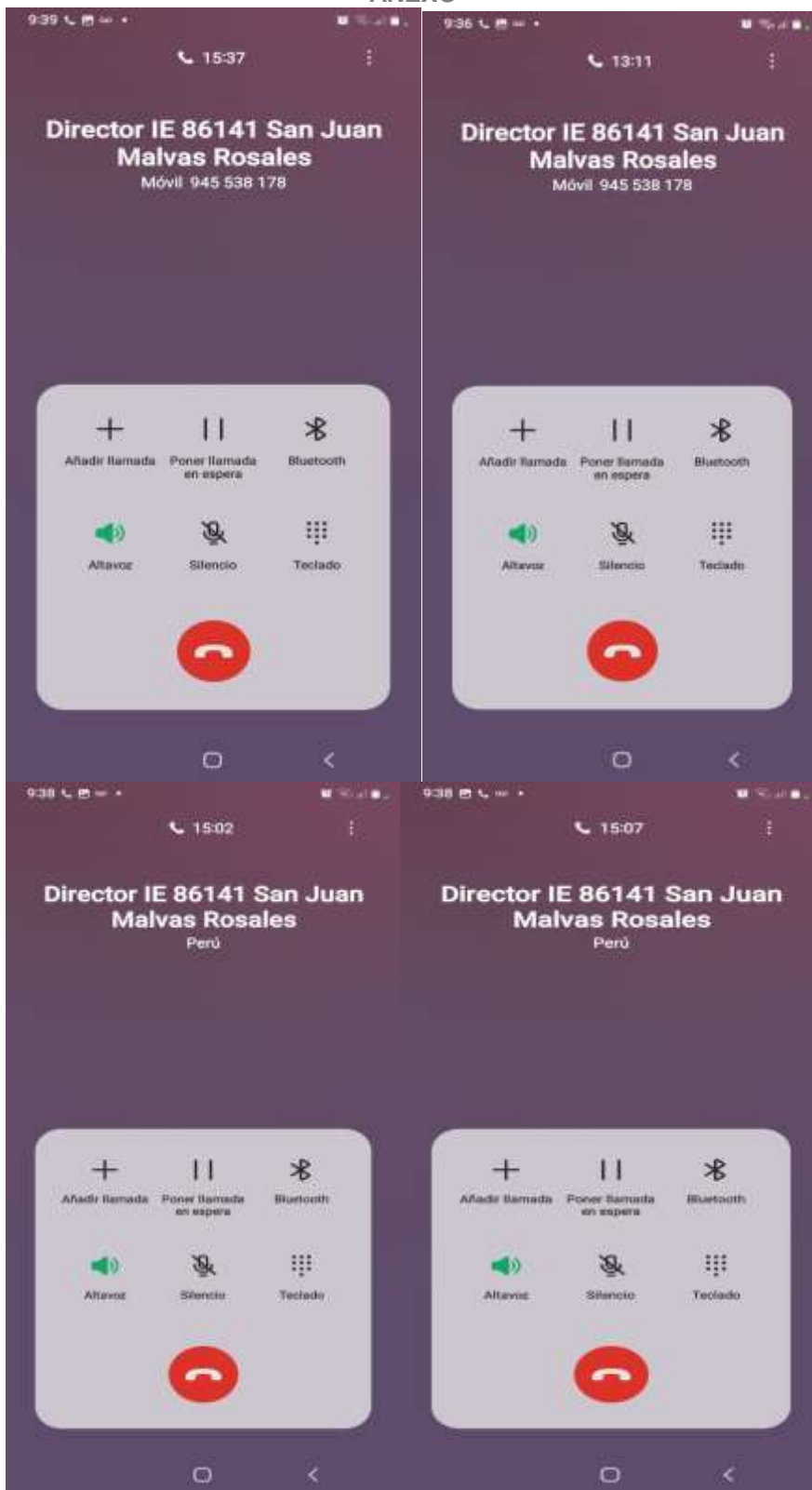
Foto 1. Llamadas telefónicas- Comunicación con miembros CAE IE 86141 San Juan de Malvas