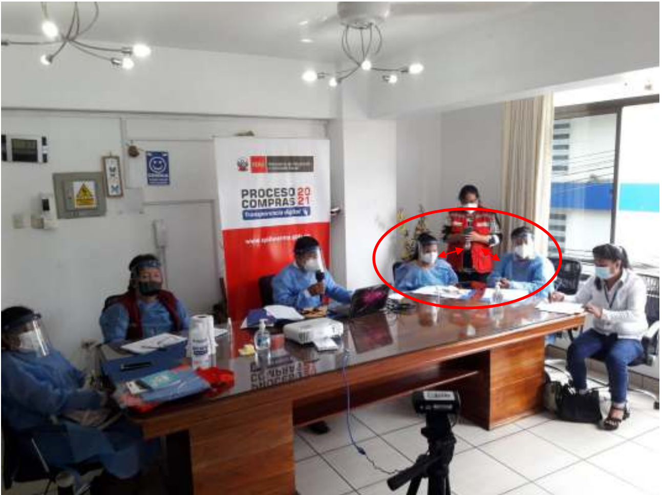
Durante el proceso de compra se evidencio que es no se guardó el distanciamiento físico no menor de un (1) metro.