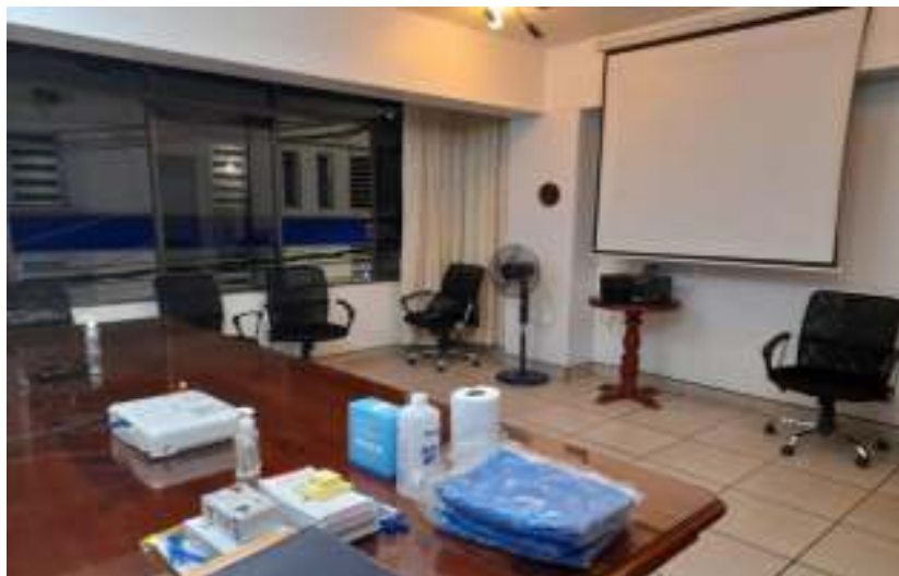
Imagen N°01 y 02: El auditorio se encuentra ventilado con capacidad máximo de 30 personas, sin embargo solo se sesionara con un total de 05 miembros del comité de compra Junín 1, 01 Supervisor de compra, 01 veedor haciendo un total de 07 personas que se reunirán en el auditorio.

Así mismo se adjunta las imágenes siguientes: