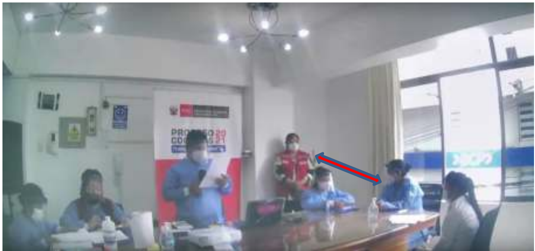
Imagen N°04: Desarrollo de la sesión de la sub etapa evaluación y calificación de las propuestas.

Imagen N°03: Inicio de la sesión de la sub etapa evaluación y calificación de las propuestas; el Presidente del CCJUNIN 1 da la bienvenida a todos los participantes de la presente sesión y da inicio a la evaluación de las propuestas.