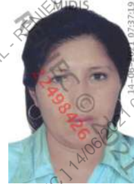
Foto del Ciudadano