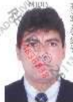
Foto del Ciudadano